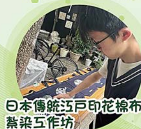
日本傳統江戸印花棉布蔡染工作坊