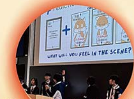
榮獲學生組全球第三名