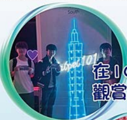
在101上 觀賞台北夜景