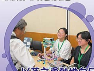
以英文勇敢地向日本評審介紹自己的作品

這一次比賽使我獲益良多。我們認識到很多不同國家的友人，並向他們介紹了我們的發明，也鍛煉了自己的口語表達和隨機應變的能力，讓我更有勇氣和自信。我們也去到了 Artec 公司參觀，看到了很多有趣的發明以及瞭解了他們互作鏈，讓我瞭解和學習到了很多，我覺得十分有趣和有意義，同時擴闊了我的見識和眼界。