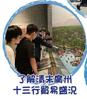
聽導遊講解鴉片戰爭