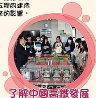
了解中國高鐵發展

作為參加了武漢交流團的一員，我度過了令人難忘的五天。在這期間，我們參觀了許多地方景點，其中楚河漢街、湖北省博物館、武漢高速鐵路職業技能訓練段、三峽大壩以及當地大學參觀，這些給我留下了深刻的印象，並對內地的發展感到由衷的讚嘆。