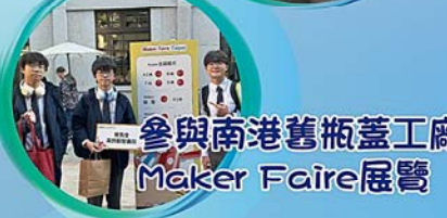
參與南港舊瓶蓋工廠 Maker Faire展覽