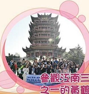
參觀江南三大名樓之一的高鶴樓