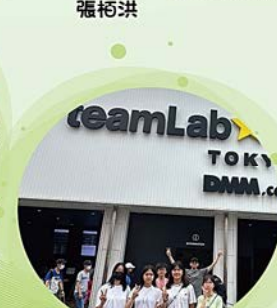
日本東京TeamLab沉浸式體驗