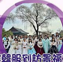
穿韓服到訪景福宮