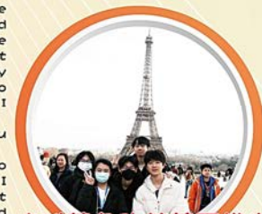
遠眺著名的艾菲爾鐵塔