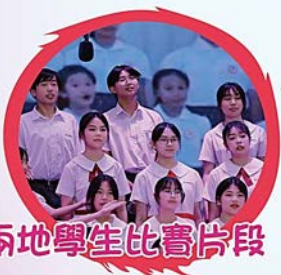
兩地學生比賽片段

本校合唱團成員早前在暑假期間聯同深圳姊妹學校合作參加了「2024年粵港澳姊妹學校歌詠比賽（深圳）」，以《紫荊花盛開》作為參賽歌曲成功通過初賽選拔，並於9月21日獲邀到深圳市福田区中學進行了決賽，最終榮獲二等獎！透過是次活動，學生能在姊妹學校進行交流、結識朋友，亦能在比賽上見識眾多優秀隊伍的精彩演出，實在大飽耳福，也獲得寶貴的參賽經驗！