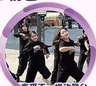
享受不一樣的舞台 讓人看見自己