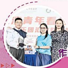
冼家軒同學 作為代表領取感謝狀