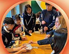
與世界各地的學者交流