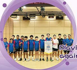
Playing in the rugby tournament against schools from China