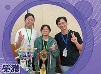
榮獲香港區高中組冠軍