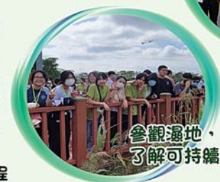
參觀濕地，了解可持續發展的重要性