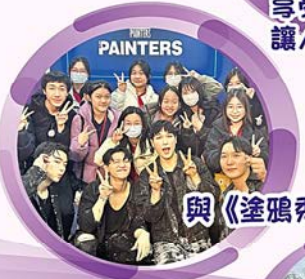
與《塗鴉秀》演員合照