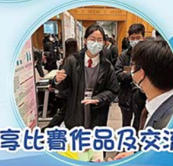
分享比賽作品及交流