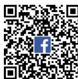
全港小學 「我是 KOL！」比賽臉書